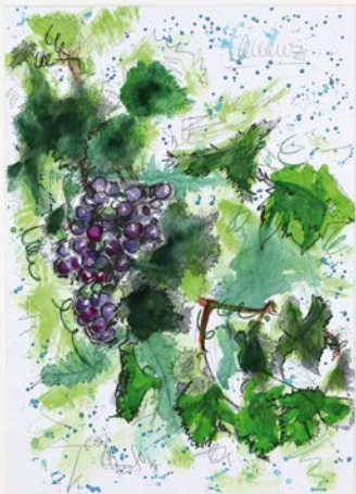
Uvas 1 (2020)